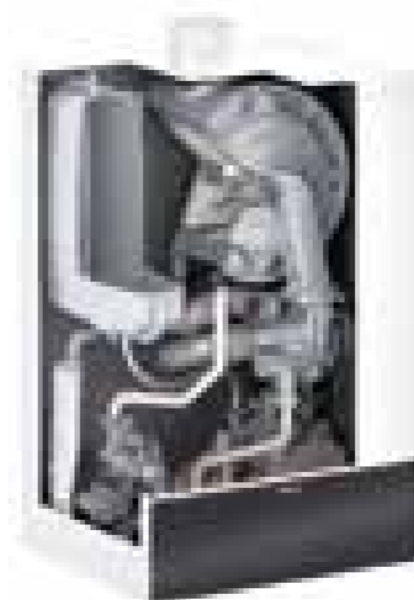
Gas-Brennwert-Wandgerät Vitodens 200-W 2,5 bis 32 kW Energieeffizienzklasse A

Viessmann One Base vernetzt digitale Services mit den kompletten Energiesystemen von Wärmepumpen, Lüftungsanlagen, Stromspeichern und Photovoltaik- Anlagen.