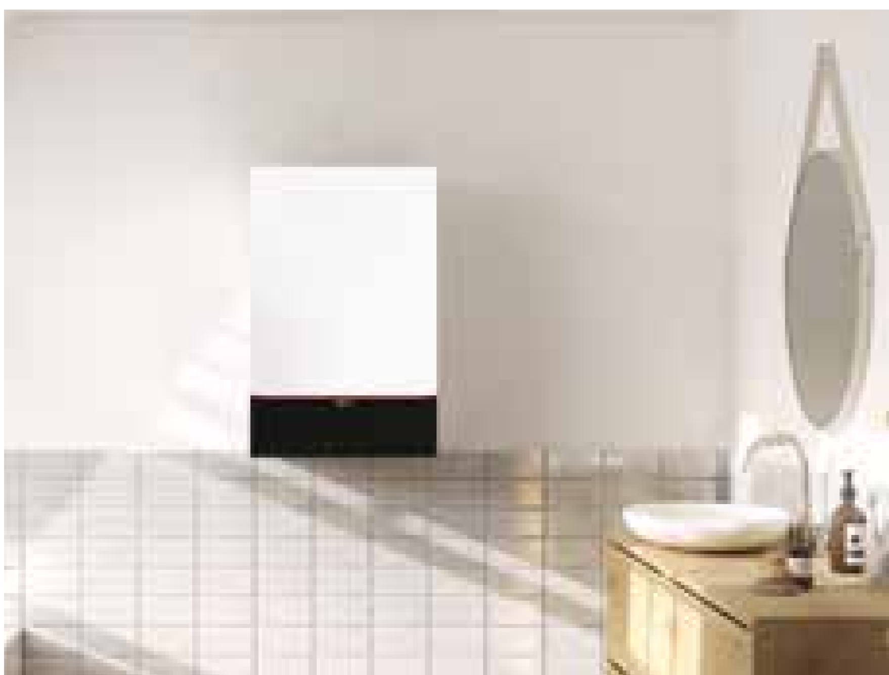
Vitodens 200-W mit attraktivem Design in der Farbe Vitopearlwhite

Ideal für die Eigentumswohnung oder das Einfamilienhaus